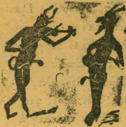
Ο Γρόννης κι' ο Μαρής, μελοῦνε κι' ἀπορεῖς.

ΣΥΝΔΡΟΜΗ ΕΤΗΣΙΑ ΔΡ. 10. ΑΛΛΟΔΑΠΗΣ ΦΡ. 10.