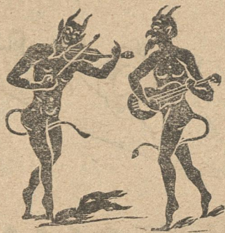
Ὁ Γράννης κι' ὁ Μαρῆς μιλοῦνε κι' ἀπορεῖς.

Γ.— Ἄκου τὸ εὐαγγέλιον τὸ πρῶτον καὶ σπουδαῖον. Συνέδριον πρεσβευτικὸν ἐκ Γερμανῶν καὶ Αὐστριακῶν καὶ ἄλλων Ἰουδαίων, συνήλθε καὶ συνέροχεται καὶ πάλιν ὄλο ἓνα, ἀλλὰ καὶ σ' ἀποτέλεσμα δὲν ἔρχεται κανένα, ἔνεκα τοῦ τὰ πράγματα ἔχουν πολὺ στενέψει καὶ τὴν Ἑλλάδα δὲν μπορεῖ κανένας νὰ χωρέψῃ.