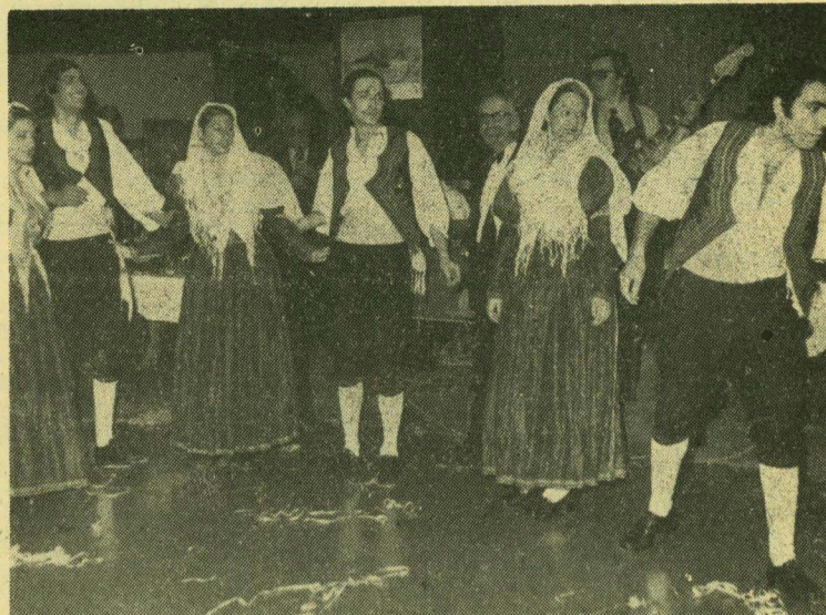
Τό χορευτικό από Λευκαδίτοπο υλα, με τις παραδοσιακές τοπικές ένδυμασίες, «νοσταλγικό ξάφνιασμα» για τους Λευκαδίτες, μέσα στις καταφώτιστες αίθουσες του «Κίγκ Μίνως»