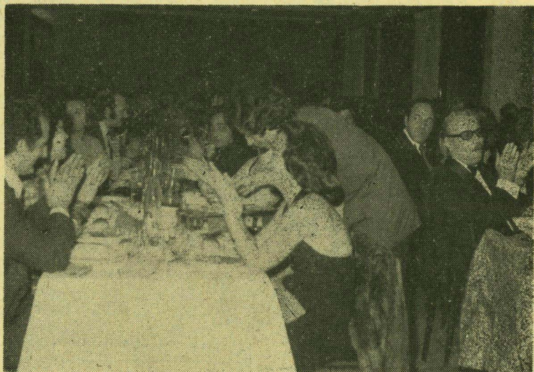
Ἀποψὶ τῆς αἰθούσης τοῦ ξενοδοχείου «Κίνγκ Μίνως» σὲ στι- γμὴ πού τὸ κέφι θρίσκει στὸ «ζενίθ» του

Ἀξιωματικὸς εἶναι τὸ γεγονὸς ὅτι φέτος δὲν ἀκούστη- καν παράπονα, ἰδίαιτα κατὰ τὴν στιγμὴ τῆς ταξιδιότησεως τῶν συμπατριωτῶν μας, καὶ τοῦτο, κατὰ τὴν γνώμη μας, ὁ