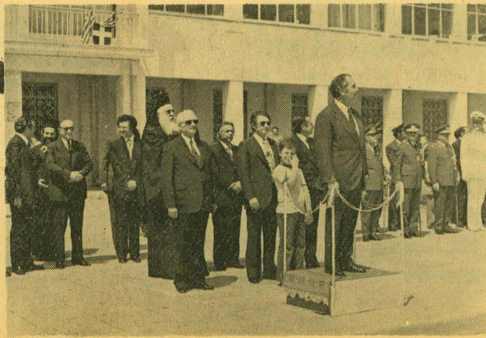
'Ο 'Υπουργὸς κ. Χρ. Στράτος ἐνῶ παρακολουθεῖ τὴν παρέλαση κατὰ τὴν 'Επέτειο τῆς 21ης Μαΐου.

'Ο 'Υπουργὸς Δημοσίων 'Εργῶν κ. ΧΡΙΣΤΟΦ. ΣΤΡΑΤΟΣ ὡς Ἐκπρόσωπος τῆς Κυβερνήσεως καὶ ὁ Βουλευτὴς Μεσσηνίας κ. ΑΡΙΣΤ. ΚΑΛΑΤΖΑΚΟΣ ὡς 'Εκπρόσωπος τῆς Βουλῆς τῶν 'Ελλήνων, ἐπεσκέφθησαν τὴν Κεφαλονιά, ἐπ' εὐκαιρίᾳ τῆς 'Επετείου τῆς 21ης Μαΐου 1864, 'Ἡμέρα τῆς 'Ενώσεως τῆς 'Επτανήσου μὲ τὴν 'Ελλάδα.