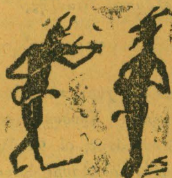
Ο Γιάνης κι' ο Μαρής, μελοῦνε κι' ἀπορρίζ.

ΣΥΜΦΟΡΗ ΕΤΗΣΙΑ ΔΡ. 10. ΔΑΔΟΔΑΠΗΣ ΦΡ. 10.