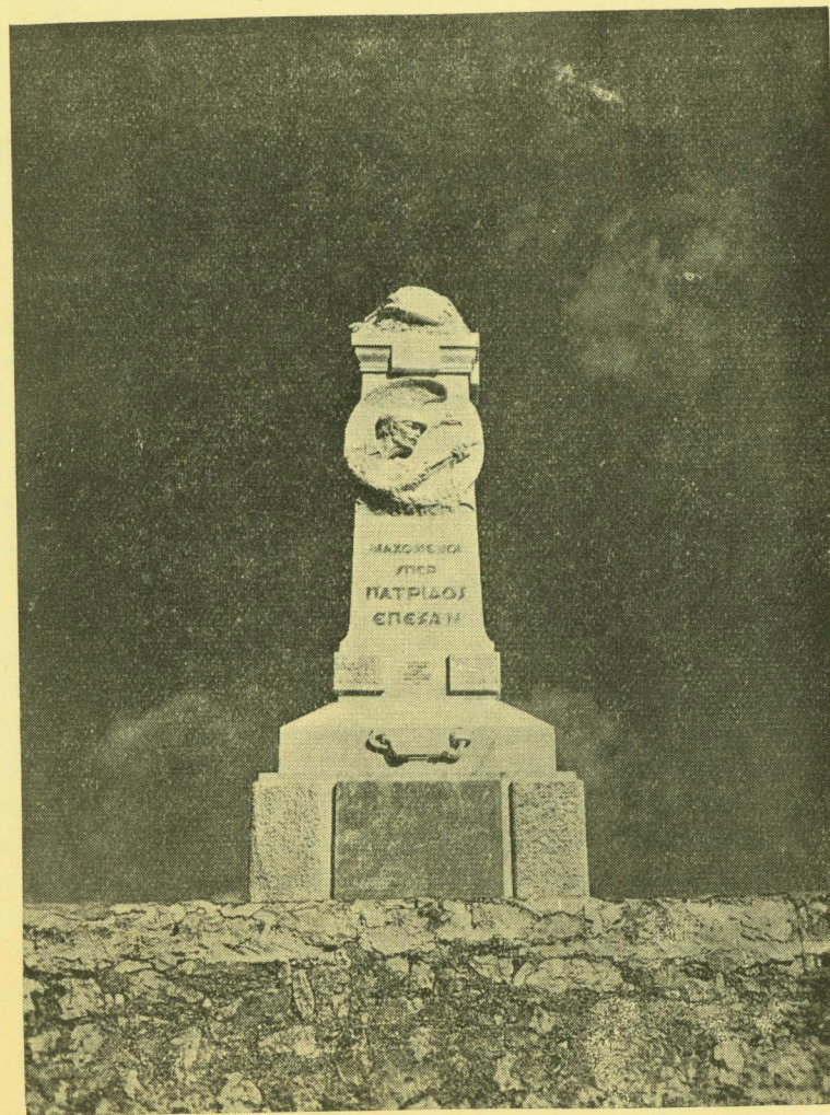
ΙΑΚΩΒΑΤΕΙΟΣ Τὸ Ἡρῶν Ἰθάκης. ΔΗΜΟΣΙΑ ΚΕΝΤΡΙΚΗ ΒΙΒΛΙΟΘΗΚΗ ΜΟΥΣΕΙΟ ΛΗΣΟΥΡΙΟΥ