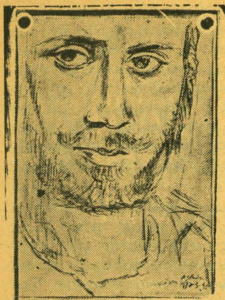
ΓΙΑΝΝΗΣ ΤΣΑΡΟΥΧΗΣ (Σκίτσο του ιδίου)

πρώτο σκαλί του Σωστοῦ. Προσοχή όμως. "Όλες οι σκάλες δὲν ὁδηγοῦν ἐκεῖ.