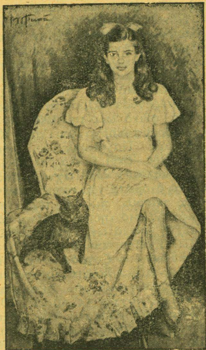
ΑΓΛΑΪΑΣ ΠΑΠΑ: Πορτραῖτο κόρης

Γεννήθηκε στα 1868 και σπούδασε κι' αυτός στην Ιταλία, στην Βασιλική Ακαδημία της Νεαπόλεως απ' όπου τιμήθηκε με το άργυροῦν μετάλλιον ἀρίστης ἐπιδόσεως. Ο Σαμαρτζής δεν περιόρισε την τέχνη του σ' ένα ξεχωριστό είδος. Όλα τὰ θέματα τὸν ἐμπνέουν. Καί τὸ τοπεῖο καί ἡ προσωπογραφία καί ἡ ἀγιογραφία. Καί όλα μεταδίδουν μιὰ συγκινησιακή θερμότητα, προτὸν ἀληθινῆς καλλιτεχνικῆς ἐξομολογήσεως. Ἀπὸ τοὺς πίνακες τοῦ Σαμαρτζή, «Ἡ Λειτουργία τοῦ Ἁγίου Σπυρίδωνος» εἶναι μιὰ τελειωμένη σύνθεση παρ' ὅλες τὶς δυσκολίες ποὺ ἀντιμετωπίζει τὸ θέμα. Ἀπειρες φιγούρες ἀπὸ στρατιῶτες, παιδάδες καί λαό, δοξολογοῦν τὸν Ἅγιο προστάτη, ἀσάλευτο στὸν χρυσοφτιαγμένο του θρόνο. Τὸ φῶς τῆς ἡλιοφώτιστης ἡμέρας ἐνώνει θαυμάσια τὴν δύναμη τοῦ συνόλου. Μιὰ δύναμη ποὺ γεννιέται καί ἀπὸ τὴν πίεση τῶν μικρῶν διαστάσεων τῆς ἐπιφανείας (εἶναι 75 ἐπὶ 45 ἐκατοστά). Πάντως ἂν θέλαμε νὰ λέγαμε ὅτι ὁ Σαμαρτζής ἀγαποῦσε ἰδιαίτερα ἓνα θέμα, χωρὶς αὐτὸ νὰναι ἀπολύτως ἀληθινὸ—θὰ λέγαμε τὴν προσωπογραφία. Σχέδιο, πλάση, ἔκφραση, πλούσια δοσμένες ἀρετὲς ἀπὸ τὸν ζωγράφο στὸ πορτραῖτο. Ἀναφέρουμε ἀπ' αὐτά, τῶν ποιητῶν Μαρκοῦ καί Πολυλά, ποὺ ὑπάρχουν στὴ