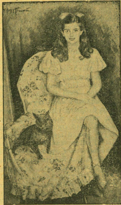
ΑΓΛΑΪΑΣ ΠΑΠΑ: Πορτραίτο κόρης

Γεννήθηκε στα 1868 και σπούδασε κι αυτός στην Ιταλία, στην Βασιλική Ακαδημία της Νεαπόλεως όπου τιμήθηκε με το αργυρούν μετάλλιον άριστης επιδόσεως. Ο Σαμαρτζής δεν περιόρισε την τέχνη του σε ένα ξεχωριστό είδος. Όλα τα θέματα τον έμπνέουν. Και το τοπείο και η προσωπογραφία και η άγιογραφία. Και όλα μεταδίδουν μία συγκινησιακή θερμότητα, προτόν αληθινής καλλιτεχνικής έξομολογήσεως. Από τους πίνακες του Σαμαρτζή, «Η Λειτανία του Αγίου Σπυρίδωνος» είναι μία τελειωμένη σύνθεση παρ'όλες τις δυσκολίες που αντιμετώπιζει το θέμα. Απειρες φιγούρες από στρατιώτες, παιδάδες και λαό, δοξολογούν τον Άγιο προστάτη, ασάλευτο στον χρυσοφτιαγμένο του θρόνο. Το φως της ηλιοφώτιστης ημέρας ενώνει θαυμάσια την δύναμη του συνόλου. Μία δύναμη που γεννιέται και από την πίεση των μικρών διαστάσεων της έπιφανείας (είναι 75 επί 45 εκατοστά). Πάντως αν θέλαμε να λέγαμε ότι ο Σαμαρτζής αγαπούσε ιδιαίτερα ένα θέμα, χωρίς αυτό να είναι απόλυτως αληθινό—θα λέγαμε την προσωπογραφία. Σχέδιο, πλάση, έκφραση, πλούσια δοσμένες άρετες από τον ζωγράφο στο πορτραίτο. Αναφέρουμε απ'αυτά, των ποιητών Μαρκορά και Πολυλά, που υπάρχουν στη