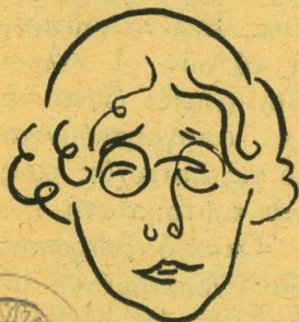
ΑΛΚΗΣ ΘΡΥΛΟΣ (Σκίτσο Κ. Πανιάρα)

« Δὲν καταλαβαίνω ποῖο εἶναι ἀκριβῶς τὸ ἐπίκεντρο τοῦ ἐρωτήματός σας. Θέλετε νὰ σᾶς πῶ ποιὲς πιστεύω πὼς εἶναι οἱ νέες τάσεις στὴ λογοτεχνία ἢ νὰ σᾶς πῶ ποιά εἶναι ἡ ἐντύπωσή μου ἀπὸ τὰ σημερινὰ νιάτα; Στὴν πρώτη περίπτωση τὸ ἐρώτημα θὰ ἀπαιτοῦσε γι' ἀπάντηση μιὰ ὀλόκληρη μελέτη, ἡ ὁποία θὰ στηριζότανε καὶ σὲ πολλὰ ἄστατα δεδομένα, γιατί εἶναι περίπου ἀδύνατο νὰ καθορισθοῦν ἀπὸ τώρα οἱ τάσεις τῶν νέων. Στὴ δεύτερη περίπτωση νομίζω ὅτι ἀποβλέπετε σὲ μιὰ γενίκευση ἡ ὁποία δὲν μοῦ φαίνεται ὅτι μπορεῖ νὰ ἔχει πολὺ νόημα. Δὲν ἐπικρίνω τοὺς χαρακτηρισμοὺς πού καταγοῦν τὸ ἄτομο, γιατί τοὺς θεωρῶ θεμελιώδεις. Τὰ νιάτα δὲν εἶναι ἓνα κοπάδι· κάθε νέος ἔχει τὴ δική του ψυχολογία, νοοτροπία καὶ προσωπικότητα. Πὼς νὰ δοῦμε ὅλους τοὺς νέους μαζί, σὰ ν' ἀποτελοῦν μιὰ ὄντοτητα;