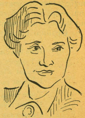
ΜΙΡΑΝΤΑ (Σκίτσο Κ. Πανιάρα)

Σας εύχομαι όλοψύχως, σε σας που ξεκινάται νά φτάσετε στο