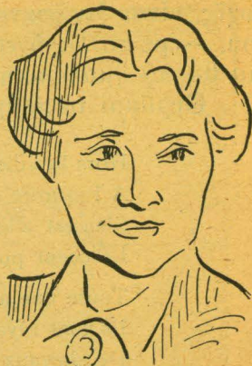
MIPANTA (Σκίτσο Κ. Πανιάρα)

Σας εύχομαι ολοψύχως, σε σας που ξεκινάτε νά φτάσετε στο