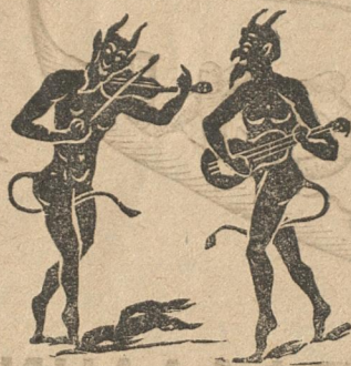
Ὁ Γιάννης κι' ὁ Μαρκῆς μιλοῦνε κι' ἀπορεῖς.

Μ.— Πού πᾶς μωρὲ καὶ κρύβεσαι ; Πού τρέχεις καὶ σὲ χάνω ; Γ.— Τοῦν Τούρκωνε, μωρὲ Μαρκῆ, χάνω τὸ δραγουμάνο.