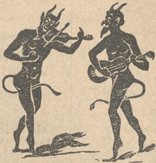
Ὁ Γιάννης κι' ὁ Μαρῆς μιλοῦνε κι' ἀπορεῖς.

Γ.— Τὸ λοιπὸν τὰ γεγονότα, πῶς τὰ βλέπεις ; πῶς τ' ἀκοῦς ; Μ.— Τώρα πλέον καληγύχτα ! Τσῶφαγα τσ' Αὐστριακοὺς. Τσῶφαγα τσ' ἀφορεσμένους καὶ τσῶτίναξα τὴ θάχη ποῦ μὲ νότιες κάθε λίγο μῶχαλοῦσαν τὸ στομάχι καὶ στὴν Ἠπειρο κι' ὀλοῦθε μῶθολῶναν τὰ νερά. Ρῶσσοι ἐν φιλοπατρίᾳ ἔξεσκλίσαν τὴν Αὐστρία τὴν κακιά μας πεθερά.