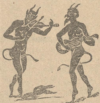
Ὁ Γράννης τοῦ Λευτέρη, αὐτὰ τοῦ ἀναφέρει.

Τ' εἶν' ἐτοῦτα, Λευτεράκη, ποῦ μᾶς κάνεις κάθε λίγο ; Μῶροχεται χωρὶς τ' ἀστεῖα ἀφ' τὸ κόμμα σου νὰ φύγω γιατὶ δὲν ἀντέχω πιά νὰ σὲ βλέπω νὰ θυμώνης καὶ ν' ἀφίνης τὰ κουπιά μεσ' τὴν ὥρα π' ἀρχινᾶνε νὰ θολώνουν τὰ νερά. Τὸ παρόκαμες Μεσσία. Κι' εἶναι δευτέρη φορὰ !