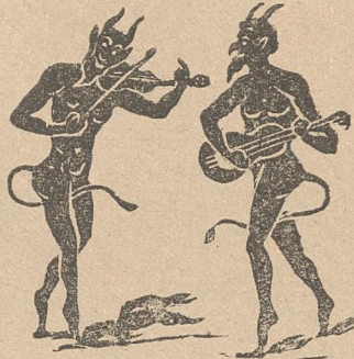
Ὁ Γιάννης κι' ὁ Μαρῆς μελοῦνε κι' ἀπορεῖς.

Γ.— Ποῦ ἐγύριζες κανάγα ; Λείπεις κάμποσον καιρὸ ! Μ.— Μὴ θωτᾷς τὴ συμφυρᾶ μου !