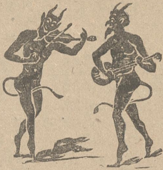
Ο Γράννης κι' ο Μαρῆς μιλοῦνε κι' ἀπορεῖς.

Γ. — Μ' ὄσες ἀπόπειρες λοιπὸν κι' ἄν ἔκαμ' ὁ Λευτέρης, τ' ἀποτελέσματα, Μαρῆ, τὰ εἶδες καὶ τὰ ξέρεις. Τοῦ κάκου μὲ τὸ Σύνταγμα παλεῦει κι' ἀγωνιέται, κι' αὐτὰ τὰ λόγια τῆς πυγμῆς ὅλα βερσὲ τ' ἀκοῦμ' ἔμεις κι' ὁ Ρήγας δὲν κουνιέται. κι' ἄν ἔφαε τὰ σίδηρα σὲ πόλεμο νὰ βγοῦμε, ἔμεις οὐδετερότητα ἀπὸ θάνατ' οὐ βαστοῦμε.