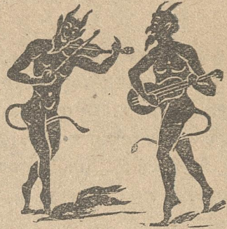
Ὁ Γιάννης κι' ὁ Μαρῆς μιλοῦνε κι' ἀπορεῖς.

ΓΡΑΦΕΙΑ ΔΙΕΥΘΥΝΣΕΩΣ 54 - ΟΔΟΣ ΚΑΛΛΙΘΕΑΣ - 54