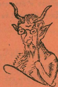
Διαδόχου έκλογή, που ντουνιάς θ' έκπλαγή.

Μ. — Έν όνόματι και λόγω Βελζεβούλ καταχθονίου, του κυρίου και προστάτου του παρόντος Ζιζανίου, και της φάρας της έν "Αδη της έν πίσσα κοχλαζούσπης, της τò κράτος του "Ρωμής"ε κατ' αυτάς προστατευούσπης, και των τόσων κερασφόρων της κολάστως άγγέλων, των τεχνάσμασιν μυρίοις ένοχλούντων τόν Τσιγκέλον, και του όφους εκείνου που με τόη σγαριλιχ, εκατάφερε τήν Εύα ν' άνεβή και στη μηλιά για να βλιάζη άφ' τούς πόνοους τή στιγμή που θα γεννά' και παντός του παλατίου του άράπη Σατανά, προκλαμάρω και κηρίσω στενωρεία τή φωνή, πώς ή έδρα ή καινή τ' άλησμόνητου εκείνου που στο Δράπανο φυλάζει. έφυλάσσετε μονάχα για τò Γιάννη που στελιάζει.