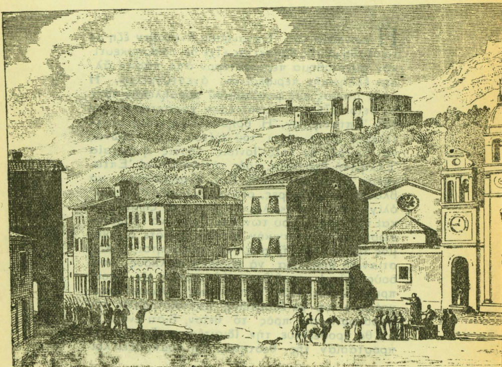
Συνοικία τῆς Ζακύνθου

Οὕτω ἐκάστη, οἰκογένεια ἢ μᾶλλον πᾶν οἰ-