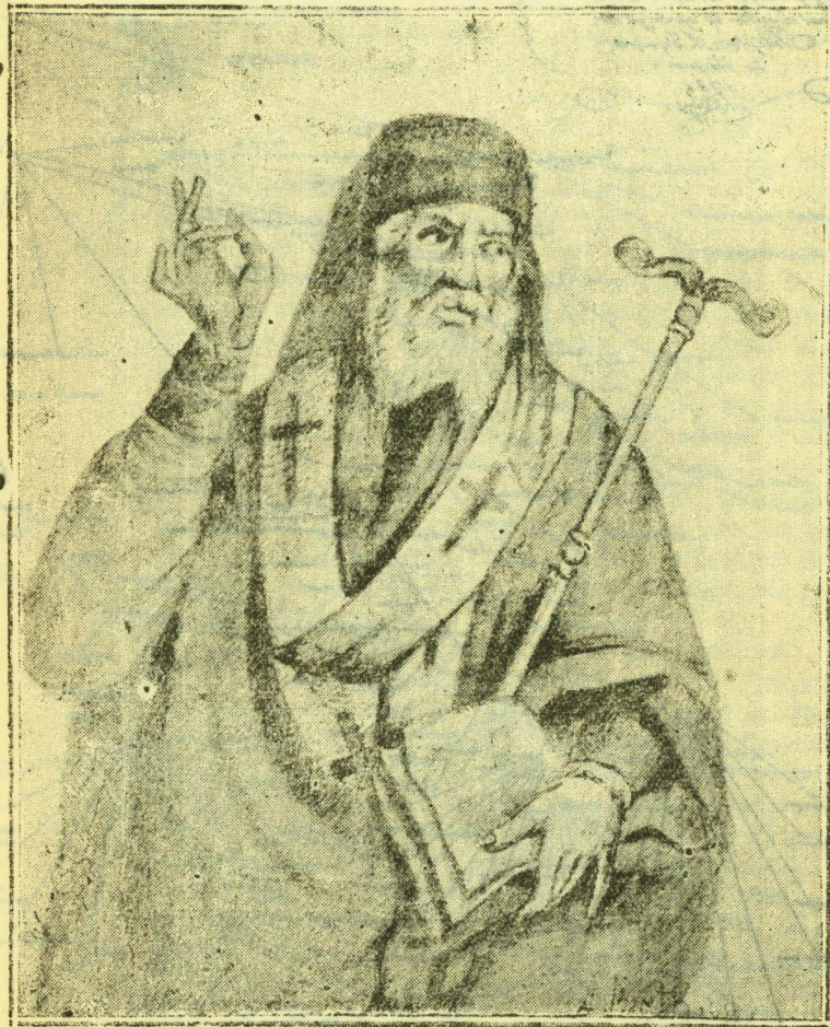
ΙΑΚΩΒΑΤΕΙΟΣ Ἡ εἰκὼν τοῦ Ἁγ. Διονυσίου.

ἐκεῖνοι τῶν ὁποίων λόγῳ τῶν θαυμάτων τῶν,