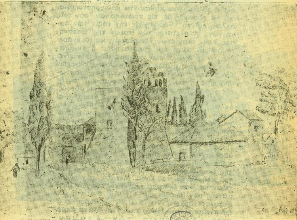
Ἡ Μονὴ τῆς Ἀναφωνητρίας

Αὕτη εἶχεν ὡς ἔμβλημα ὀφθαλμὸν μετὰ τὴν ἐπιγραφὴν «Γρηγορεῖτε». Τὸ ἱερὸν ταμεῖον ἢ ἡ ἱερὰ ἀδελφότης, ἡ συσταθεῖσα τῷ 1622 ἐν Κερκύρᾳ καὶ Ζακύνθῳ, διὰ τὴν κηδεύῃ εὐπρεπῶς τοὺς ἀκτῆμονας πένητας. Τὸ ἀπὸ τοῦ 1653 μέχρι σήμερον ἔτι ἀνελλιπῶς ἐν Ζακύνθῳ λειτουργοῦν γραικοκομεῖον τοῦ Δημητρίου Κομούτου. Ἡ ἀπὸ τοῦ 1656