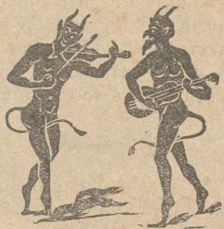
Ο Γράννης κι' ο Μαρῆς μιλοῦνε κι' ἀπορεῖς.

Γ.— Ὅπως ὁ Χάμπλεϊ ἔχασε τ' αὐγά με τὸ καλάθι πώτρωνιότουνε πολὺ κι' ἀδύνατον ἐστάθη ἐν τῇ φιλοσοφίᾳ του τὸ πρόβλημα νὰ λύσῃ, νὰ ζῆ κανεὶς ἢ νὰ μὴ ζῆ σ' αὐτὴν τὴ μαύρη φύσι, ἔτσι κι' ἐγὼ κυτιάζοντας τὸ ἐθνικὸ τὸ χάλι μου παιδεύομαι, μωρὲ Μαρῆ, καὶ σπᾶω τὸ κεφάλι μου γιὰ ναῦρω τίνος ἄραγε ἢ γνώμη ὀρθοτέρα ; Τοῦ Βασιλῆά μας τοῦ κλεινοῦ ἢ τοῦ σγαρῆλου τ' ἄλλουνοῦ πῶχει γιαλιὰ στὰ μάτια του καὶ βλέπει πούλιο πέρα ;