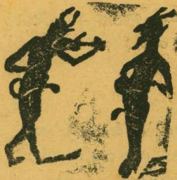
Ο Γράννης κι' ο Μαρής, μελοῦνε κι' ἀπορεῖς.

ΣΥΝΔΡΟΜΗ ΕΤΗΣΙΑ ΔΡ. 10. ΔΑΔΟΔΑΠΗΣ ΦΡ. 10.