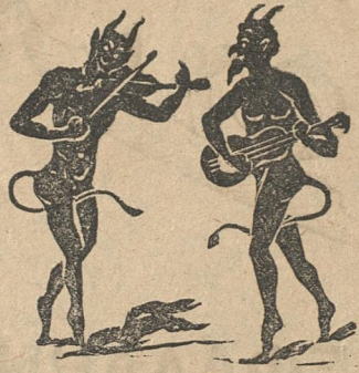
Ὁ Γιάννης κι' ὁ Μαρῆς μιλοῦνε κι' ἀπορεῖς.

Μ.— Τάμαθες Ἀρετοῦσα μου τὰ θλιβερὰ μαντάτα ; Λένε πῶς εἶναι στὸν ἀτμὸ τῶ Ἐυρώπης τὰ φουσατά.