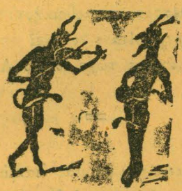
Ο Γριάννης κι' ο Μαρής, μελοδνε κι' άπορεϊς.

ΣΥΝΔΡΟΜΗ ΕΤΗΣΙΑ ΔΡ. 10. ΔΑΛΔΟΔΑΠΗΣ ΦΡ. 10.