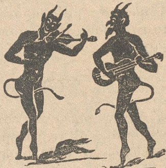
Ο Γράννης κι' ο Μαρῆς μελοῦνε κι' ἀπορεῖς.

M.— Μωρ' τί συμβαίνει ; Δὲ μοῦ λὲς ; Γ.— Σκασμὸς καὶ μὴ φοβᾶσαι. M.— Φοβῶμι πῶς ὁ πόλεμος ἐμύρισε. Γ.— Πλανᾶσαι. M.— Μ' ἀφοῦ ὁ πρέσβυς ἔφυγε ἀπὸ τὴν Πόλι, χάχα, τί ἄλλο περιμένουμε ; Γ.— Κι' ἂν ἔφυγε τί τάχα ; Κι' ἐγὼ πολλάκις ἔφυγα, γιὰ πάντα νὰ σ' ἀφήσω καὶ ὁμῶς βλέπεις πῶς ἐδῶ μοῦ μέλλει νὰ ψωφήσω.