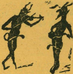
Ο Γράννης κι' ο Μαρῆς, μελοῦνε κι' ἀπορεῖς.

Μ. — Λέγε λοιπόν τί σκέπτεσαι και τί διανοεῖσαι, Γ. — Μωρὲ κακογεράματε ἀκόμα ὄξου εἶσαι; Ἀκόμα δὲν σ' ἐκλείσανε στὴ χάψι νὰ ψωφήσης ἀναπαμῆνες κι' ἤσυχες τσ' ἐρχόντισσες ν' ἀφήσης; Γιατὶ πειράζεις μασκαρὰ κάθε κακῶνα και κυρά; Καθένας εἶν' ἐλεύθερος νὰ ζήσῃ ὅπως θέλῃ. Ἐσένα τί σὲ μέλλει;