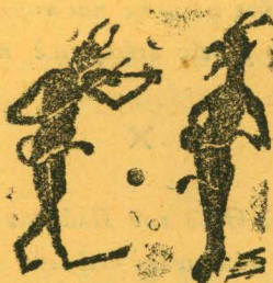
Ο Γζάννης κι' ο Μαρής, μιλοῦνε κι' ἀπορεῖς.

ΣΥΝΔΡΟΜΗ ΕΤΗΣΙΑ ΔΡ. 10. ΔΙΑΔΟΧΑΠΗΣ ΦΡ. 10.