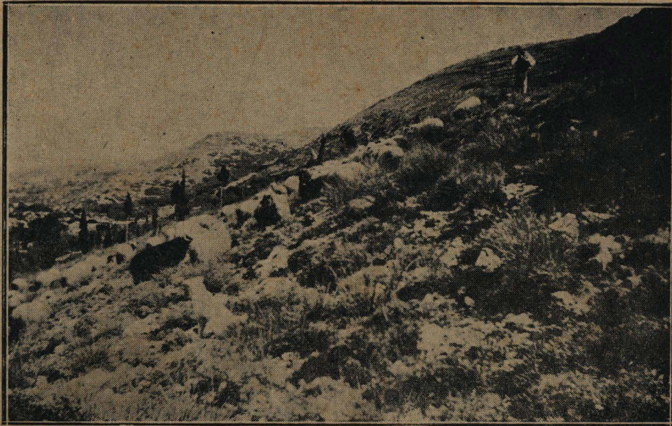
Η ΒΟΣΚΗ ΕΙΣ ΤΑΣ ΠΛΑΓΙΑΣ ΤΟΥ ΒΟΥΝΟΥ

ΙΑΚΩΒΑΤΕΙΟΣ ΔΗΜΟΣΙΑ ΚΕΝΤΡΙΚΗ ΒΙΒΛΙΟΘΗΚΗ ΜΟΥΣΕΙΟ ΜΕΣΟΓΕΙΩΝ