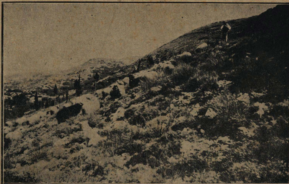
Η ΒΟΣΚΗ ΕΙΣ ΤΑΣ ΠΛΑΓΙΑΣ ΤΟΥ ΒΟΥΝΟΥ