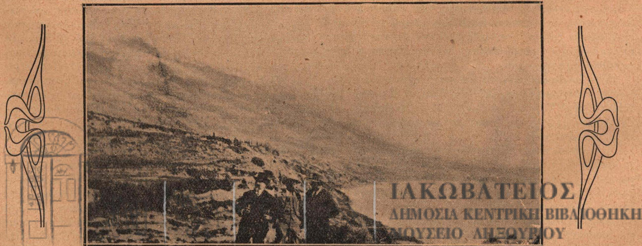
Τὸ «Τραπεζάκι» μὲ τὸν Αἶνον χιονοσκεπῇ ὑπερθεν.