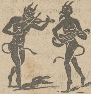
Ο Γιάννης κι' ο Μαρκής μιλούνε κι' άπορείς.

ΓΡΑΦΕΙΑ ΔΙΕΥΘΥΝΣΕΩΣ 54 - ΟΔΟΣ ΚΑΛΛΙΘΕΑΣ - 54