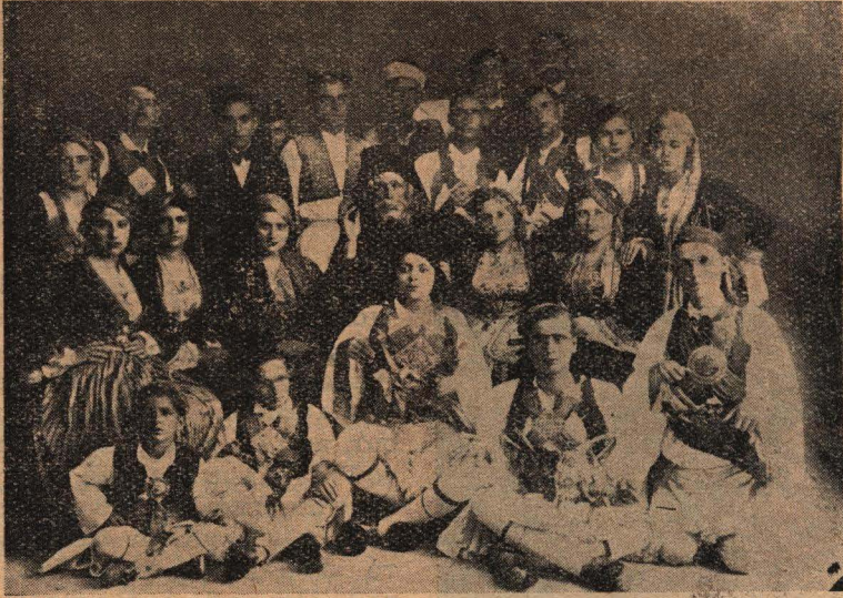
Οἱ λαβόντες μέρος εἰς τὴν παράστασιν τῆς «ἐξόδου τοῦ Μεσολογγίου»

Τὰ αὐτοκίνητα ποὺ κάνουν τὶς διαδρομὲς αὐτὲς ὅλα εἶναι καλὰ. Ἄλλὰ καὶ οἱ ὁδηγοὶ τοὺς ἔχουν ψυχῆς εὐγένεια, ὅπως καὶ οἱ βαρκάρη-