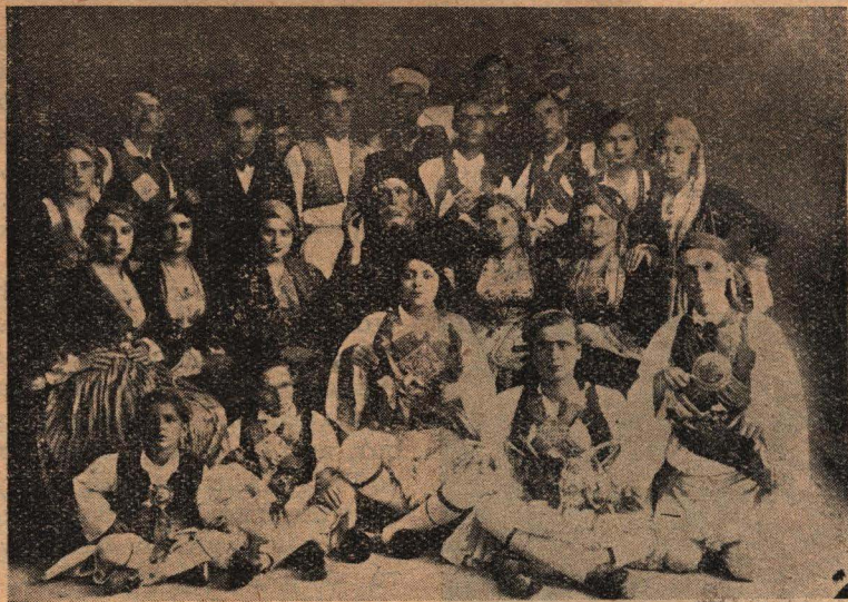
Οἱ λαβόντες μέρος εἰς τὴν παράστασιν τῆς «ἐξόδου τοῦ Μεσολογγίου»

Τὰ αὐτοκίνητα ποὺ κάνουν τὶς διαδρομὲς αὐτὲς ὅλα εἶναι καλὰ. Ἀλλὰ καὶ οἱ ὁδηγοὶ τοὺς ἔχουν ψυχῆς εὐγένεια, ὅπως καὶ οἱ βαρκάρη-